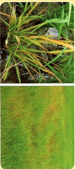
Hình 6. Triệu chứng bệnh vàng lùn