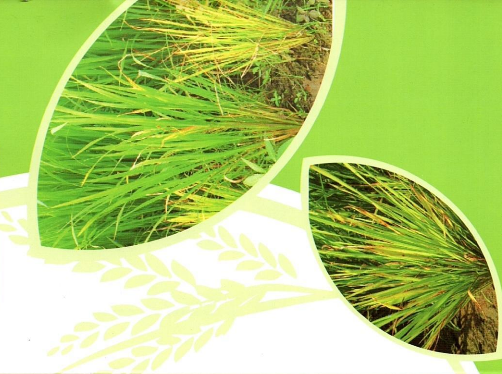
Hình 4. Triệu chứng bệnh lùn lúa cỏ