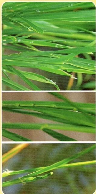
Hình 5. Triệu chứng bệnh lùn xoắn lá