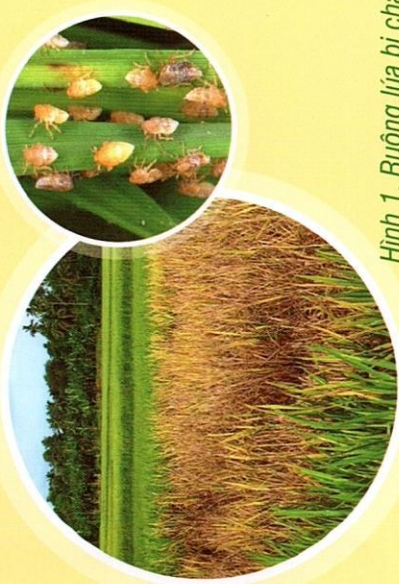
Hình 1. Ruộng lúa bị cháy rầy

a. Gây hại trực tiếp: Rầy nâu chích hút nhựa cây lúa, khi mật số cao gây ra hiện tượng cháy rầy.