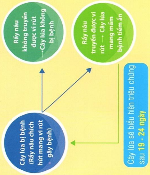
Hình 2. Sơ đồ truyền bệnh VL, LXL của rầy nâu